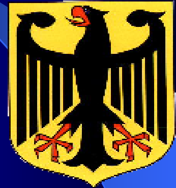
Lambang Negara Jerman